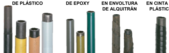
REVESTIMIENTOS PROTECTORES PARA TUBERÍAS DE ACERO

LA INFORMACIÓN PROPORCIONADA AQUÍ PUEDE NO SER TOTALMENTE INCLUSIVA. PARA PRÁCTICAS DE PREVENCIÓN DE DAÑOS POR EXCAVACIÓN E IDENTIFICACIÓN POSITIVA DE TUBERÍAS, CONTACTE A COLUMBIA GAS EN COLUMBIAGASOHIO.COM/EXCAVATORS .